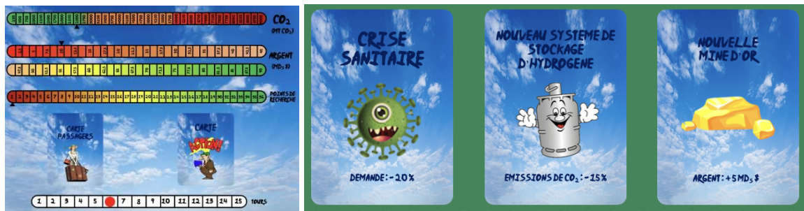
Figure : gauche : le plateau ; droite : exemple de cartes événements.