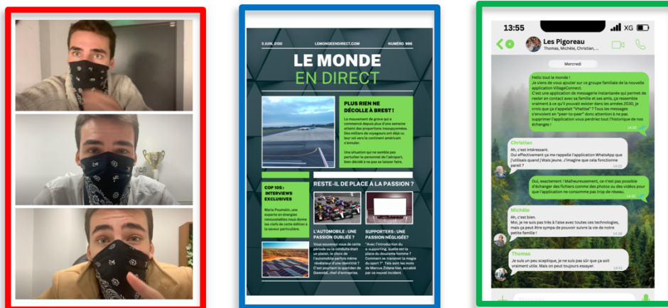
Figure : gauche : vidéo du scénario rouge (la loi du plus riche, où les riches se barricadent dans des places fortes), milieu : journal du scénario bleu (une société raisonnée, comportant quelques hubs aériens près des océans), droite : image de la conversation du scénario vert (une nation de villages sans aviation et où le seul déplacement permis est pour les études).

surconsommation et de pression environnementale dans notre façon de voyager et dans notre mode de vie.