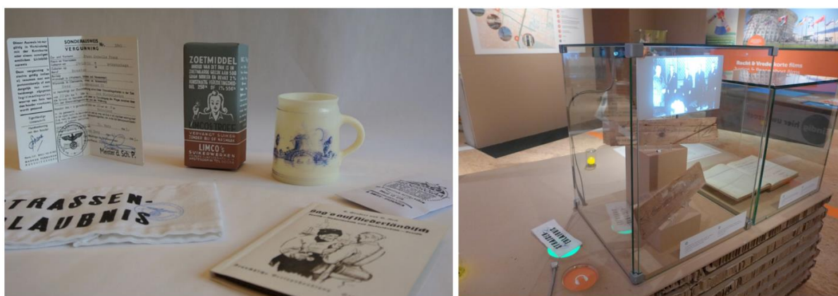
Figure 2 : le projet meSch au Museon (La Hague, Pays-Bas), à gauche les artefacts tangibles et à droite une station interactive activée avec le « brassard du fonctionnaire ».

Le projet « meSch » (Petrelli et al. , 2013 : 58-63) s'est appliqué quant à lui à fournir une expérience augmentée aux visiteurs à travers l'utilisation d'artefacts tangibles interactifs 9 . Lors d'une des expérimentations au Museon (La Hague, Pays-Bas), les visiteurs peuvent choisir parmi six fac-similés celui qui les accompagnera pendant leur visite (Figure 2). L'objet choisi détermine la langue (néerlandais ou anglais) et le point de vue de la narration (soldat, civil ou fonctionnaire). Différentes stations interactives disséminées dans l'exposition permettent de jouer un contenu personnalisé lorsque le visiteur place l'objet sur le socle prévu à cet effet 10 . La comparaison avec une interface de choix sur un téléphone portable a démontré la préférence des utilisateurs pour les interactions tangibles (Petrelli et O'Brien, 2018 : 1-12). Le consortium européen a également fourni des outils et des méthodes pour permettre aux conservateurs de construire les objets interactifs, les scénarios et les contenus associés (Not & Petrelli, 2018 : 3–19). Cependant, la personnalisation est ici limitée à un petit nombre de caractéristiques : la langue et le point de vue de la narration.