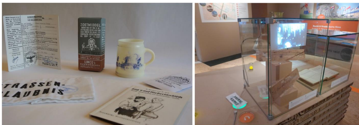
Figure 2 : le projet meSch au Museon (La Hague, Pays-Bas), à gauche les artefacts tangibles et à droite une station interactive activée avec le « brassard du fonctionnaire ». Images extraites de (Petrelli et O’Brien, 2018), © Petrelli et O’Brien.

Le projet « meSch » (Petrelli et al. , 2013 : 58-63) s’est appliqué quant à lui à fournir une expérience augmentée aux visiteurs à travers l’utilisation d’artefacts tangibles interactifs 9 . Lors d’une des expérimentations au Museon (La Hague, Pays-Bas), les visiteurs peuvent choisir parmi six fac-similés celui qui les accompagnera pendant leur visite (Figure 2). L’objet choisi détermine la langue (néerlandais ou anglais) et le point de vue de la narration (soldat, civil ou fonctionnaire). Différentes stations interactives disséminées dans l’exposition permettent de jouer un contenu personnalisé lorsque le visiteur place l’objet sur le socle prévu à cet effet 10 . La comparaison avec une interface de choix sur un téléphone portable a démontré la préférence des utilisateurs pour les interactions tangibles (Petrelli et O’Brien, 2018 : 1-12). Le consortium européen a également fourni des outils et des méthodes pour permettre aux conservateurs de construire les objets interactifs, les scénarios et les contenus associés (Not & Petrelli, 2018 : 3–19). Cependant, la personnalisation est ici limitée à un petit nombre de caractéristiques : la langue et le point de vue de la narration.