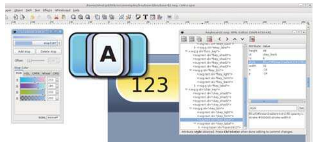
Figure 3 : Le fichier SVG de description des éléments graphiques du clavier, réalisé avec Inkscape.

Le travail d'élaboration graphique a été réalisé avec Inkscape (cf Figure 3). Dans un premier fichier SVG, le designer a créé tout d'abord une touche du clavier par couches graphiques superposées. 8 calques sont définis dont un calque lumière activé lors de l'appui de touche (événement curseur Press ) et un groupe de calques pour réaliser l'ombre portée. Ces calques sont nommés et groupés en un unique composant SVG. Pour tester la composition globale, les touches sont ensuite dupliquées, organisées et modifiées pour générer une maquette de principe du clavier. La création visuelle de la zone supérieure, incluant l'afficheur texte, une touche "backspace" et un fond dégradé, complète cette maquette.