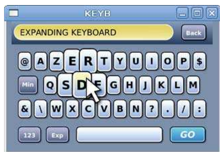
Figure 2 : L'application test clavier en mode "expanding keyboard".

Nous avons expérimenté la réalisation d'une application test par un designer graphique utilisant Hayaku afin d'illustrer la méthode proposée.